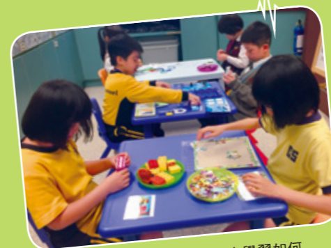
學生在專注力訓練小組中學習如何專注地完成自己桌上的任務，挑戰自己

福利協會致力以「愉快地有效學習」為宗旨，目標讓有特殊學習需要的學童能在充滿鼓勵和欣賞的環境下學習，以提升他們的學習動機和自信。在推展特殊學習需要服務時，學童並非唯一的對象，福利協會亦很重視家長的工作，因為減輕家長的照顧壓力和減少家長與學童因指導功課而出現的衝突，能有助改善親子關係。因此，福利協會在各青少年服務單位提供全面性的特殊學習需要支援服務，包括：個別評估、治療性的個別和訓練小組、成長小組、家長小組及講座、興趣班和朋輩輔導計劃，以提升特殊學習需要學童的學習能力，幫助他們應付各項的成長需要。