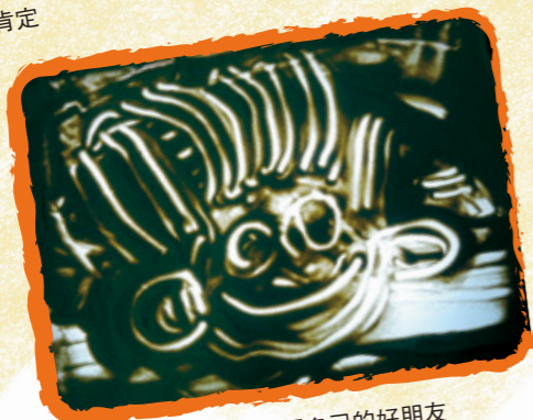
沙畫：孩子介紹自己的好朋友