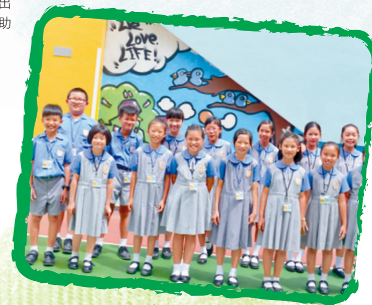
青苗計劃的小老師

推行「小老師計劃」及「關愛大使計劃」等，鼓勵高年級學生協助初小學生，藉此培養學生擁有一顆關愛他人之心，成為同伴的小天使，共同建構關愛共融的校園環境。