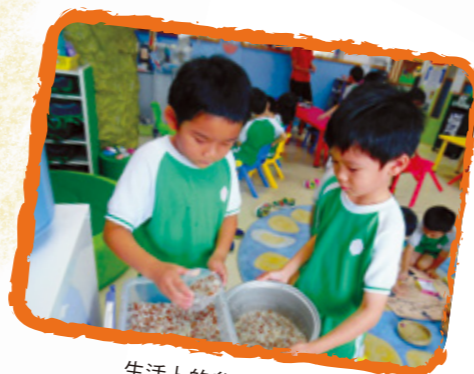
生活上的參與，才是 最具動力及最綜合式的訓練