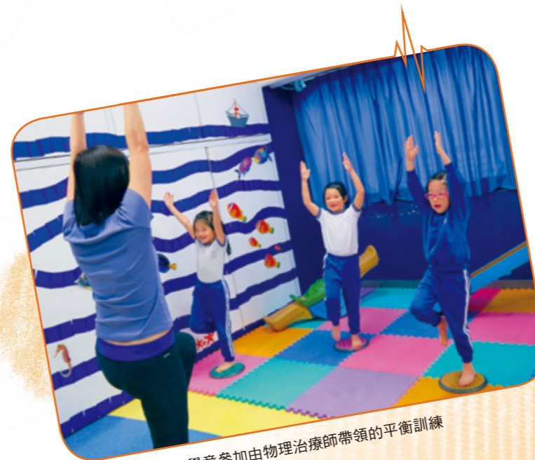
學童參加由物理治療師帶領的平衡訓練

計劃於學童的「黃金時期」作出適切的早期介入。跨專業團隊除了為學童提供到校的個人或小組訓練及專業治療外，更支援教師及家長的需要。治療師為教師提供專業諮詢、教師培訓、示範及課室管理的多元策略建議等，讓教師掌握學生的需要及訓練進展，配合課堂學習。家長支援工作方面，透過工作坊及講座讓家長以正面的態度及有效的技巧培育有特殊需要的兒童。