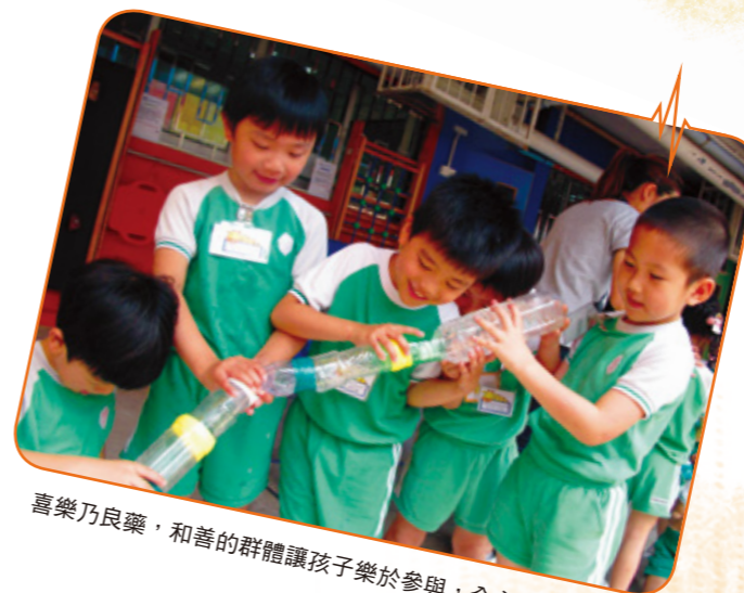
喜樂乃良藥，和善的群體讓孩子樂於參與，全心全腦的投入

按照兼收兒童的能力及發展需要編入不同的年級，有助建立兒童的自信心，並創造同儕共學的氛圍。輔導教師或各級老師對培育幼兒目標一致，會因應不同校情設計混齡教學或運動，讓全校員生輕鬆交流，寓學習於遊戲。