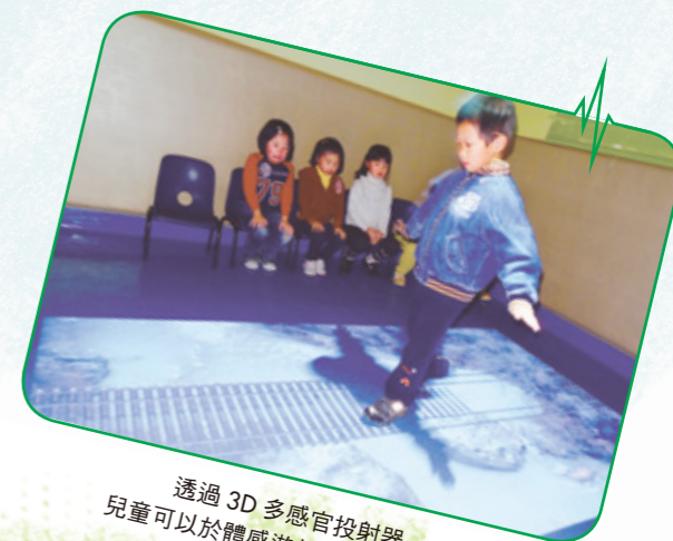
透過 3D 多感官投射器， 兒童可以於體感遊戲中訓練專注力， 同時亦提升學習的趣味

計劃利用 3D 體感投射器、香薰機、平板電腦、發聲教材等配套設備，讓學童透過 Visual, Auditory, Kinesthetic (VAK) 多感官治療的刺激加強兒童的視覺、聽覺、觸覺、前庭覺及肌肉關節等各種感知能力。