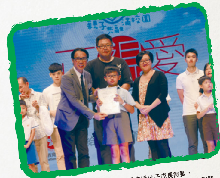
家校緊密合作，共同支援孩子成長需要，學校獲教育局頒發「親子共融滿校園」小學組「動感校園獎」