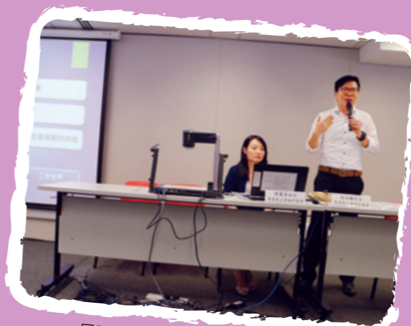
同工於教育局的講座中分享計劃的經驗

另外，福利協會了解有讀寫障礙的學生對閱讀及書寫有困難，故特別設計比較容易閱讀的教材或工具吸引學生使用，亦令他們更輕鬆地學習。在推行方面，福利協會重視跨專業的合作，如以入校方法與教師合作推行活動，令活動內容更切合學生需要。服務強調支援網絡的重要，著意促進家長的參與及對學生的支援。另一方面，為減輕家長面對的壓力，社工亦會適時提供支援。