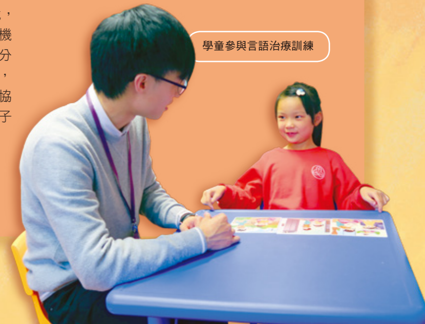
學童參與言語治療訓練

適切的專業訓練對特殊學習需要的幼兒非常重要，因此，幼兒在評估有特殊學習需要後需配合針對性的專業和持續性支援服務，而福利協會的專業團隊以跨專業的合作方式可達致最佳的治療效果。福利協會透過跨專業團隊，包括：物理治療師、職業治療師、語言治療師、臨床心理學家及特殊幼兒工作人員等為幼兒作基線評估，了解他們的需要，並與各治療師制訂個別化訓練計劃及合適的家長支援，提供有助身心發展和提升社交能力的早期介入服務，從而提高幼兒的學習成效和參與日常活動的機會。