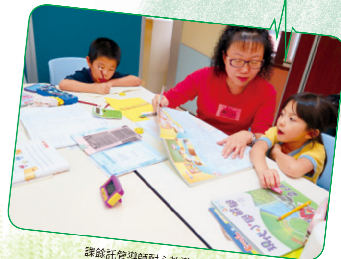
課餘託管導師耐心教導學生做功課

計劃提供課餘託管服務，人手比例為 1 對 4，即由 1 位導師照顧 4 位學生，讓導師能照顧學生的個別需要，配以合適的學習技巧和策略，讓學生更有效和愉快地學習。