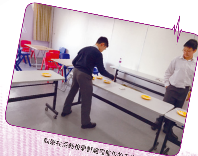
同學在活動後學習處理善後的工作

「執行功能」是指讓大腦有足夠時間透過檢視、思考訊息及計劃，最後才進行適切的行動，而一般 ADHD 的學生腦部的眼窩額葉區的活動較低、體積較少和神經傳導體量不足，影響他們的執行功能。因此，小組以「執行功能」為主題，在有關連性的「執行功能」上提供適切的訓練，增加學生對執行功能發展的認知，改善他們的功能障礙。