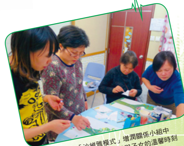
家長在「沙維雅模式」增潤關係小組中 透過藝術活動表達期望及與子女的溫馨時刻

為減輕家長的照顧壓力，舉辦「沙維雅模式」增潤關係小組。透過表達藝術讓家長關顧自己的需要，明白自己與子女彼此的期望和溝通模式。另外，亦舉辦家長講座，讓家長認識言語障礙及家居訓練的方法。