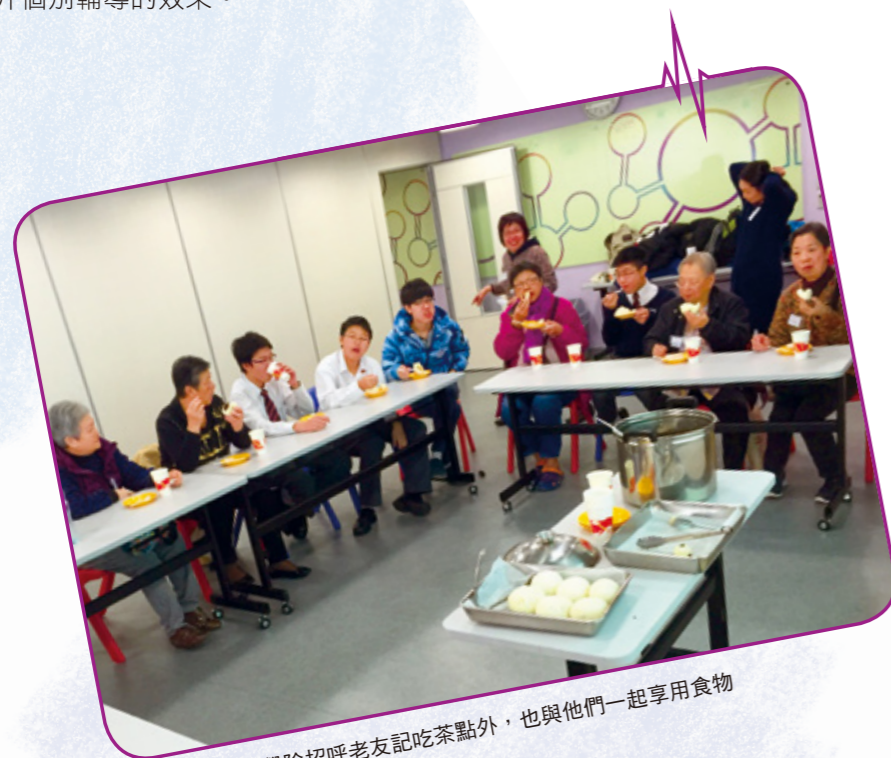
同學除招呼老友記吃茶點外，也與他們一起享用食物