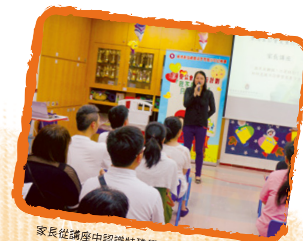
家長從講座中認識特殊學習需要及支援技巧