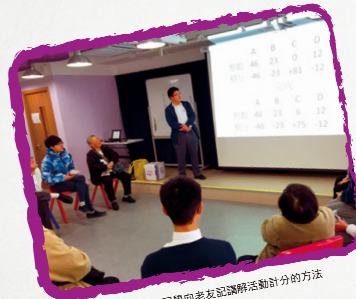
活動中，同學向老友記講解活動計分的方法

為 ADHD 的初中生提供入校小組活動是一件很具挑戰性的事。當中有不少的變數，需要工作員為不同的組別度身訂造適切的活動內容，以提升學生的專注力和興趣。活動獲駐校社工的個人輔導及其所屬中心安排義工服務，讓同學的學習得以持續。