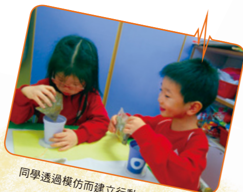
同學透過模仿而建立行動力與自信心