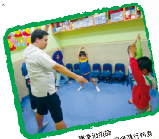
職業治療師 教導參與感統運動小組的學童進行熱身

計劃分為治療性、發展性、興趣、社區教育及互助系列 4 大範疇，以「兒童為本遊戲輔導」的輔導取向及經驗學習法培養學童獨立和自主的解難能力，使他們從深化、反省、整理及轉移 4 個過程中掌握新知識和經驗。學童於遊戲中獲得成功經驗，有助他們建構正面價值觀，最終達致強化自信及改善行為問題的重要果效。