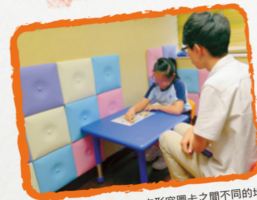
學童嘗試利用所學的複句來形容圖卡之間不同的地方