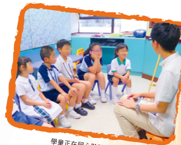
學童正在留心聆聽故事內容

家長的參與及家居訓練對言語治療的成效有著舉足輕重的影響，言語治療師十分重視家長作為學童主要溝通對象的角色，並會於訓練後提供家課練習予家長，讓家長於課堂時間及治療室以外的情境為學童提供訓練的機會。這不但加快學童掌握目標的速度，亦令他們可以把在訓練時學到的，應用於日常生活中。此外，言語治療師會於課堂後向家長交代學童的訓練進度，讓家長更了解其學童的目標及表現。另外，家居訓練亦是言語訓練的重要一環，透過針對學童能力的家居訓練，家長能嘗試協助學童把訓練所學的技巧應用於日常生活中，大大提升學童訓練目標的進度及鞏固他們的技巧。