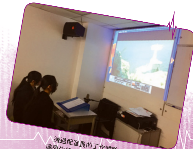
透過配音員的工作體驗，讓學生發掘自己的能力和興趣

透過家長工作坊及與家長的聯繫，以了解家長在教養讀寫障礙高中生所遇到的困難和壓力，並為他們作出個別輔導及情緒支援，讓他們有能力為其讀寫障礙子女提供適切的鼓勵和充分的支援，學習接納和明白他們的不足與強項。