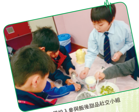
同學投入參與飯後甜品社交小組

當察覺學生有特殊學習需要情況時，社工會與學校支援主任及其他專業人員組成學生輔導及支援團隊，作出及早介入及提供支援，如駐校社工與家長聯絡，了解學生的情況及行為表現，並鼓勵家校合作，讓學生在校內及校外獲得一致的照顧及管教模式。團隊還會召開個案會議，與教師們商討如何共同在課堂上作出的支援；此外，社工重視及關心家長的需要，並協助他們了解學童的需要，加強他們的應付能力。