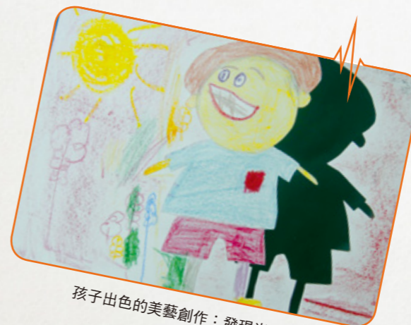
孩子出色的美藝創作：發現光與影

“十分感動能見證孩子活在基督的愛內，成為喜樂、自信、和善而健康的群體，並發現孩子的各項進步及潛能。”