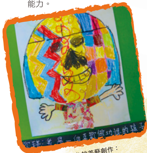
孩子出色的美藝創作： 反映孩子的自我認知及肯定

一切的學習均屬大小肌的整合動作、日常情緒狀態及生理基礎，如缺水、飢餓、能量不足、睡眠不足等，故校方特別採用健腦7式的日程滲透—包括常喝清水、呼吸新鮮氧氣、健腦飲食、充足睡眠、活腦運動、聆聽紓腦音樂及保持愉快情緒—全面提升兒童的學習能力。