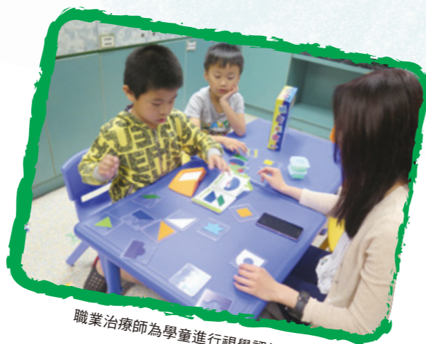
職業治療師為學童進行視覺認知訓練