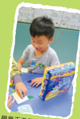
學童正進行空間關係訓練

另外，福利協會的服務配合政府政策發展。90 年代末教育局（時稱教育署）全面推展「全校參與模式」的融合教育計劃，鼓勵中、小學校訂定融合教育政策，全面推動及早識別與支援、跟進弱能學生學習進展與評估、調適課程及教學策略、安排教職員培訓與家長參與，從而提升有特殊學習需要學生的動機。因應時機，福利協會遂成立香港聖公會小學輔導服務處，於 2002 年 9 月開始承辦「全方位學生輔導服務」，協助聖公會屬校推展系統化的輔導服務，並給予學童適切支援。至今，福利協會為全港 24 所小學提供全方位小學輔導服務，服務網絡遍佈港九新界。