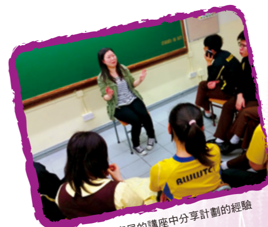
社工於教育局的講座中分享計劃的經驗

通過教師工作坊及與老師的聯繫，強化社工與老師的跨專業協作，用歷奇輔導的手法，透過訓練日營、入校小組活動和個人輔導，協助有讀寫障礙的高中生從歷奇活動、性向測試、分組討論及個別面談中，反思自己的興趣、強項及能力。