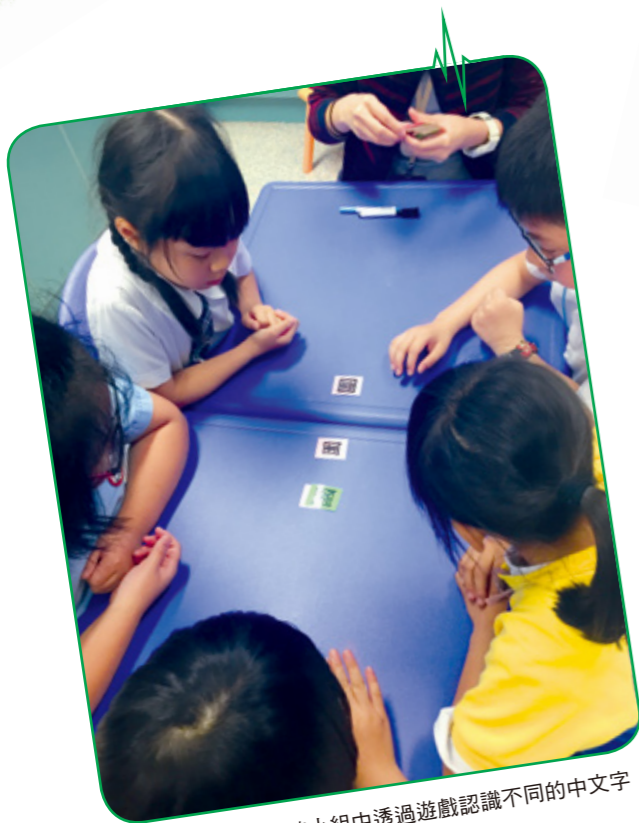
學生在讀寫訓練小組中透過遊戲認識不同的中文字