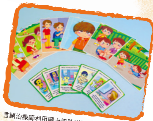
言語治療師利用圖卡協助訓練學童進階的語言能力