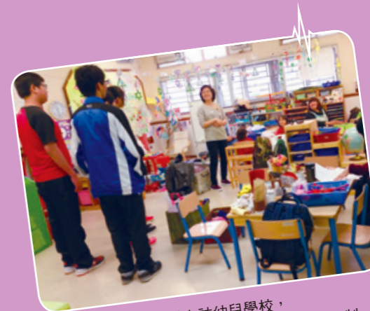
透過走訪幼兒學校，讓學生探索自己的興趣，突破自我的限制