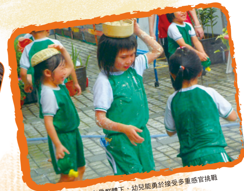
在熟悉環境及友愛群體下，幼兒能勇於接受多重感官挑戰

最佳動力與效能的學習來自生活，故校方重點幫助兼收兒童適應課堂，讓學童能夠選擇並參與不同的學習角、享受自學、適應與同學共處、學習解難或情緒調節。