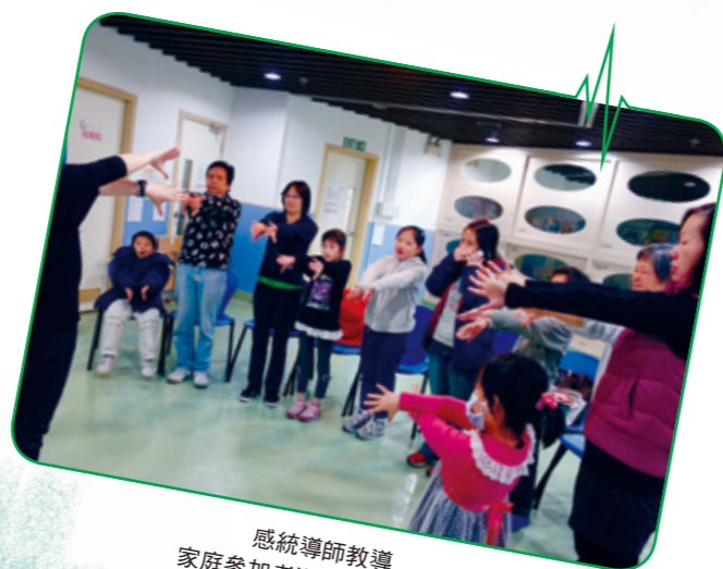
感統導師教導 家庭參加者進行親子健腦操